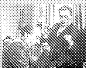
Totò e Peppino nel film

PIAZZA MAGGIORE Totò, Peppino e... la malafemmina